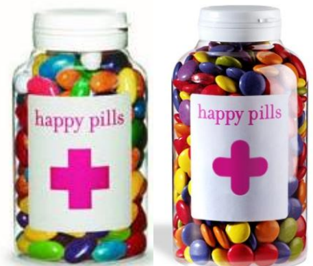
Links: oude logo

De rechter stelde echter vast dat er geen gevaar voor verwarring bestond tussen de beide tekens, voornamelijk gezien het feit dat Happy Pills een ander soort kruis gebruikt (met afgeronde randen) en een andere kleur. Ook in hoger beroep is dit onlangs bevestigd. Overigens was de vorm van het kruis eerder wel gelijk aan die van het Rode Kruis, maar heeft Happy Pills de vorm aangepast.